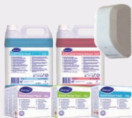
Controllo degli odori