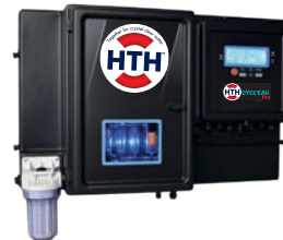
HTH™ CYCL'EAU Fisrt sistema di controllo

La combinazione di questi 3 prodotti HTH garantisce una disinfezione calibrata, affidabile e semplice, consentendo l'automazione completa e sicura del trattamento della vostra piscina.