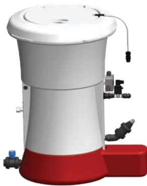
HTH™ EASIFLO™ Dosatori