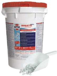
HTH™ EASIFLO™ BRIQUETTES