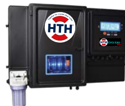
Sistema de controlo HTH™ CYCL'EAU

A combinação destes 3 produtos HTH garante uma desinfecção controlada, fiável e simples, permitindo a automatização completa e segura do tratamento da sua piscina.