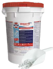
BRIQUETES HTH™ EASIFLO™