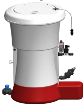
DOSEADOR HTH™ EASIFLO™