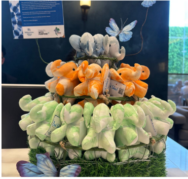
Linens For Life™