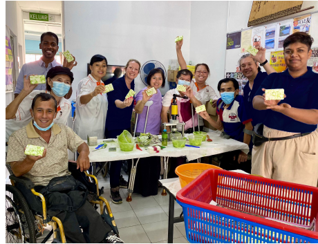
Soap For Hope™