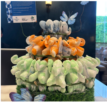
Linens For Life™