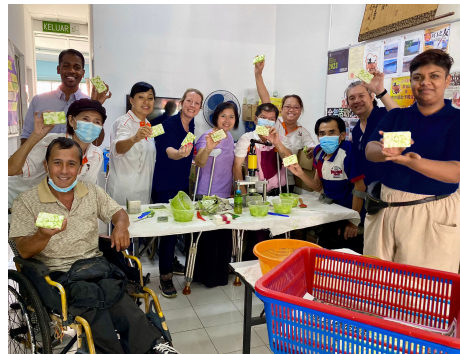
Soap For Hope™