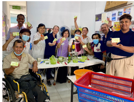
Soap For Hope™