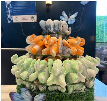
Linens For Life™

Solenis fortsatte å støtte lokalsamfunn over hele verden gjennom SolenisGives og frivillig arbeid på anleggsnivå med fokus på utdanning, helse og miljøvern. I 2025 deltok ansatte på tvers av flere regioner i lokale partnerskap og serviceinitiativer som fremmer velvære og bidrar til å styrke lokalsamfunnene der Solenis opererer.